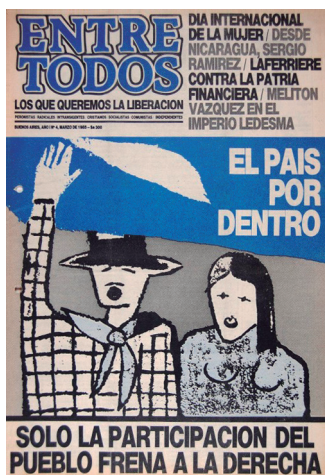
Entre Todos , marzo de 1985. Año I, N. 4.

ET se caracterizaba por desplegar grandes portadas coloridas, con imágenes que referían a sectores populares, manifestaciones artísticas o bien caricaturas políticas con grandes leyendas que remitían a los temas de la coyuntura política de la época: crisis económica, consolidación de la democracia, injerencia de los militares y sindicalismo combativo eran algunos de los tópicos principales.