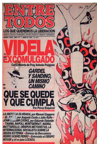
Entre Todos , junio de 1985. Año I, N. 7.