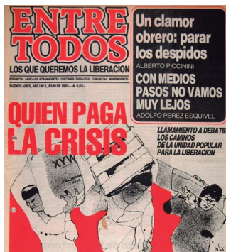
Entre Todos , julio de 1985. Año I, N. 8.

En las portadas seleccionadas, puede observarse la amplitud de los temas abordados sobre conflictos en escalas internacionales, nacionales e incluso sobre movilizaciones y protestas locales. También pueden detectarse la reivindicación a la unidad popular y la perspectiva crítica frente al deterioro económico de aquel entonces. No menos importante resulta la gráfica caricaturesca subsumida a los valores populares, crítica hacia otros actores como los medios, los grupos económicos dominantes y el mismo gobierno, y la insignia Entre Todos que buscaba resaltar y articular con el color de las frases de impacto.