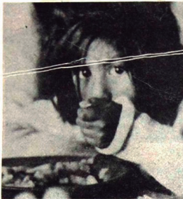
"Los niños preguntan".

cubrirían los intereses que esa deuda devengaba. Con el agravante de que al 12 de junio, se cumplían 180 días de que la Argentina no abonaba los intereses de la deuda externa pública, llevando a la banca acreedora a la alternativa de considerarla "sub-standar", es decir, que podría recargar con intereses punitivos el total de la deuda, contabilizando como pérdida los intereses no pagados.